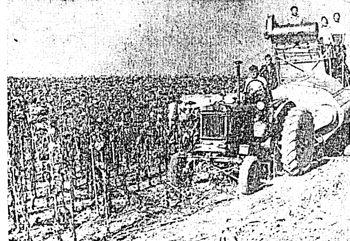
Recoltarea culturilor de toamnă se desfășoară intens în raion. Clixecul nostru înfățișează o imagine de la recoltatul sfeclei-soarelui în cooperativa agricolă de producție din Frumusești.