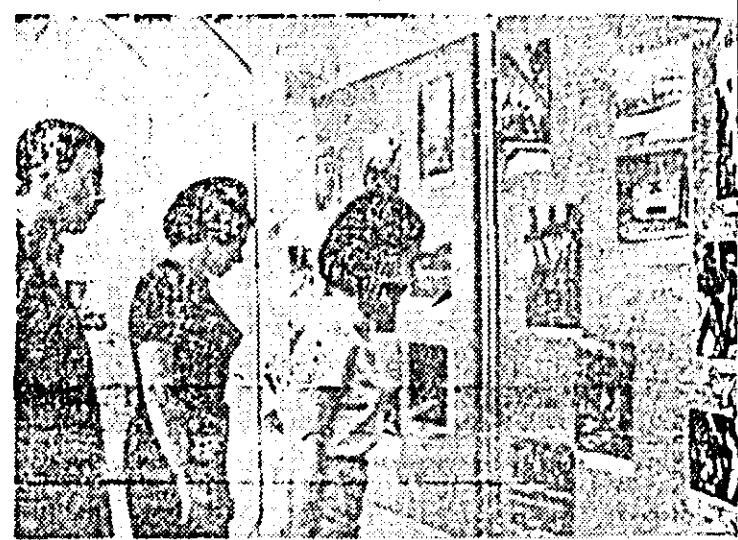
In Casa Prieteniei din Moscova s-a deschis recent o expoziție intitulată: „Construcția socialismului în România”.

SAIGON 28 (Agerpres). — Mandamentul militar american în Vietnamul de sud a început să se desfășoare cinci importante operațiuni de „curățire” în regiunile importante unități ale Forțelor Naționale de Eliberare. Într-o primă dată de la intervenția americană din Vietnamul de sud, scrie agenția France Presse, gătură cu aceste acțiuni unitățile trupelor americane au angajat te în sectorul deltei fluvialului kong la aproximativ 30 km de sud-est de Saigon”. Lupte violente între trupele americane și trupele sud-coreene și forțele patriotice în diferite regiuni ale Vietnamului de sud, îndeosebi în zona D” situată la aproximativ 100 kilometri nord de Saigon, unde gențile de presă semnalează intensificarea acțiunilor patriotice. Într-o relatare din Saigon agenția UPI transmite că avioanele militare americane continuă să bombardeze zona demilitarizată, cadrul acestor operațiuni, avioanele americane au bombardat greșeală un sat situat în provincia Quang Ngai, unde se aflau cecrați soldați sud-vietnamezi preună cu familiile lor. Pentru primelor aprecieri, 25 de persoane au fost ucise, 17 rănite, iar 100 de case au fost distruse.