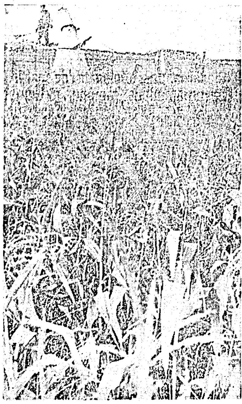
La Uvinis se recoltează intens porumbul pentru siloz. IN CLISEU: un aspect din timpul lucrului cu combina.