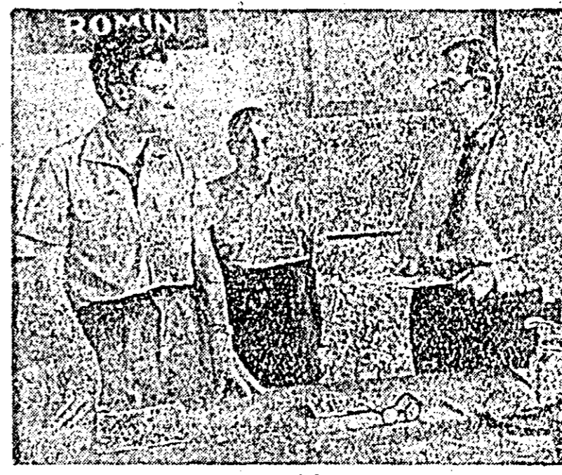
În clișeu: se înmînează diploma de fruntaș pe ramură.

din activitatea grupelor sanitare. La stațiile de radioamplificare din uzine se vor citi materiale de popularizare a realizărilor pe linie de Cruce Roșie, se vor organiza întâlniri între donatorii și primitorii de sînge, conferințe etc.