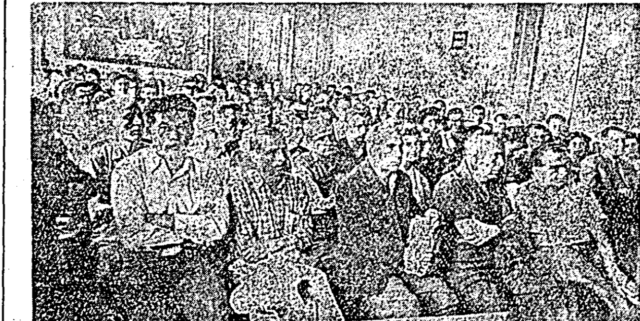
Aspect din sală. Numeroși ferovieri au fost prezenți la festivitățile decernării diplomelor.

Profitând de timpul favorabil, mai multe gospodării agricole colective au trecut, după ce au pregătit din timp terenul și semințele necesare, la însămințatul rapiței. Astfel, pînă la sfîrșitul săptămînii trecute, gospodăria colectivă din Seceani a semănat rapiță pe 33 ha, cea din Aluniș pe 30 ha și cea din Zădăreni pe 20 ha.