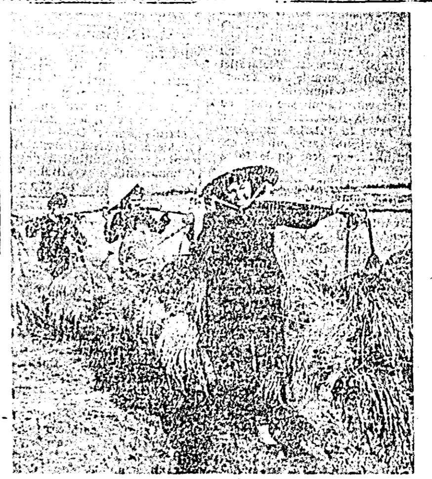
Azi, bucuria muncii libere e cea ce caracterizează activitatea oamenilor muncii de pe ogoarele R. D. Vietnam.

CINEMATOGRAFE „GH. DOJA”: Alarmă la graniță; „N. BALCESCU”: O cursă obișnuită; „I. HERBAC”: Misterul castelului părăsit; „I. L. CARAGIALE”: Melba; „TINETULUI”: Vinătoare tragică; „PROGRESUL” (Aradul Nou): Simpaticele noastre doctori; „MAXIM GORKI” (Mieciălea): Zile de dragoste; „SOLIDARITATE” (Gal): Vagabondul (seria I și II).