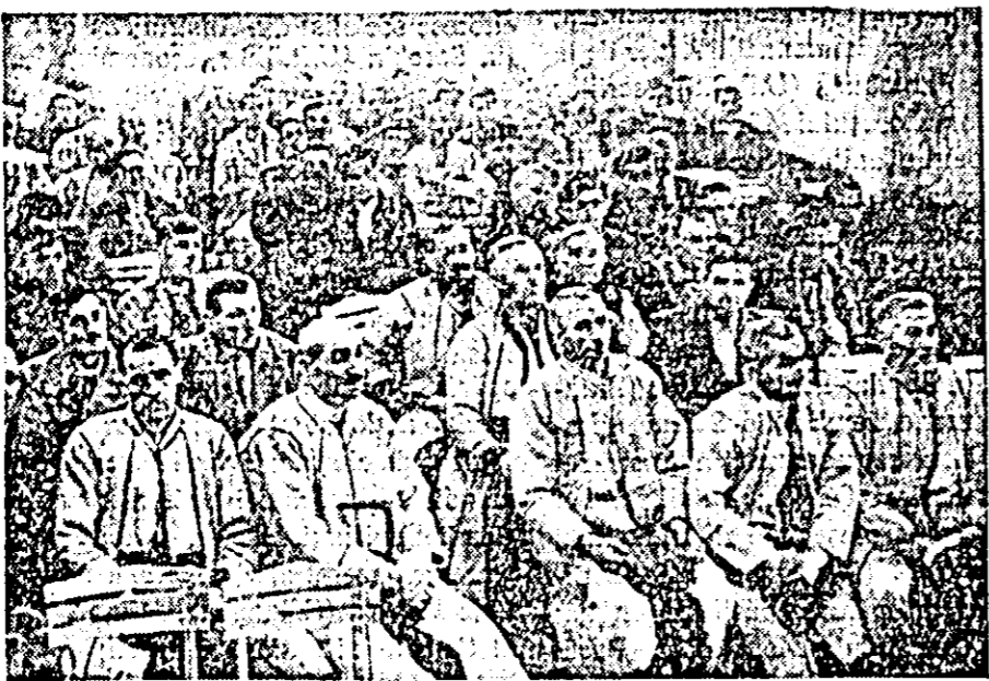
Clîșeul prezintă un aspect de la conștiuire. Participanții ascultă cu viu interes referatele ce se expun.

decarea rănilor se face greu. De multe ori, după 30 ani de rodire, merii și perii prezintă semne de bătrînețe, producția lor fiind scăzută. Dacă acești pomi au trunchiul sănătos, se poate și e indicat să se facă regenerarea coroanei, prin scurtarea puternică a ramurilor, la 1/3 sau chiar jumătate din coroană, avîndu-se grijă ca ramurile - la locul tăierii - să nu atingă grosimea de 10 cm. Prin creșterea unor noi lăstari se va putea crea o coroană, capabilă să mai producă cîtiva ani.