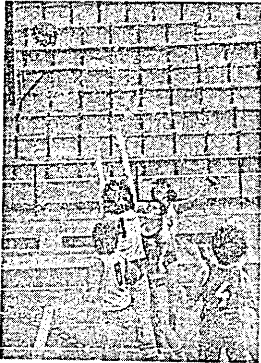
Secvență din întâlnirea de baschet dintre C.S.Ș. Arad și C.S.Ș. Deva, câștigată la un scor concludent de către arădenii.