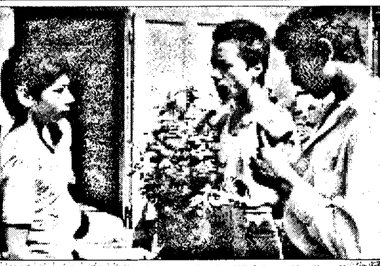
Centrul de primire minori - „juniorii” își studiază noii colegi. Doamna directoare nu e nicăieri...