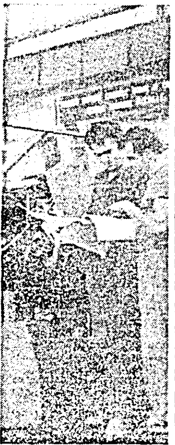
Aspect din secția montaj L.M.U.A. Se fac ultimele finisări la strungul destinate beneficiarilor externi.