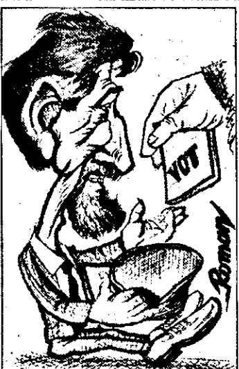
Mereu poluezi văzduhul, și faci haz chiar din necaz, Deși ești cam sărac (cu duhul), Barbă ai, dar n-ai obra! T. PACURARU, Arad

Pentru ce s-a amânat atât acest moment care era limpede că nu poate fi evitat? Simplu: pentru a nu „influența” rezultatul alegerilor locale, amânarea fiind pusă pe seama altor cauze sau pur și simplu ignorându-se discutarea acestor probleme. Aceasta este și a fost tactica guvernului în privința mai tuturor scumpirilor, de unde și situația în care am ajuns. Situație care, după alegerile parlamentare și prezidențiale, când o mică și una de alte prețuri, ținute sub obroc din motive electorale, au toate șansele să arate și mai rău. Dar, mai bine să nu anticipăm.