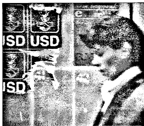
Domnișoara meditează: „Afișul UDMR-ului are autonomie teritorială pe panou?”

ne-am dat seama că partidele nu se îngheșuie să-și etaleze candidații pentru că afișele sunt scumpe și nu prea sunt bani pentru a le înlocui pe cele rupte sau degradate de vicisitudinile acestei veri, care numai vară nu a fost. Deci, liderii organizațiilor locale preferă să lipească afișele cu puțin timp înaintea alegerilor, prilej de a exclama, uitându-se la poza candidatului: „Scumpul meu!”. În schimb, cei de la centru pot să spună despre cei din teritoriu: „săracii de voi”, având în vedere faptul că acestia trebuie să vireze bani în contul Bucureștiului, dacă vor afișe.