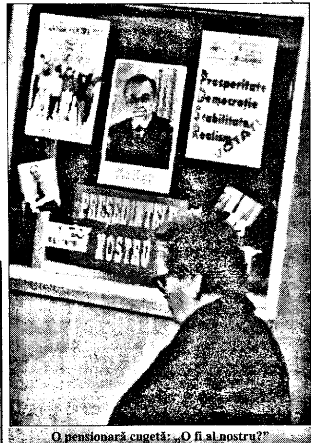
O pensionară cugetă: „O fi al nostru?”