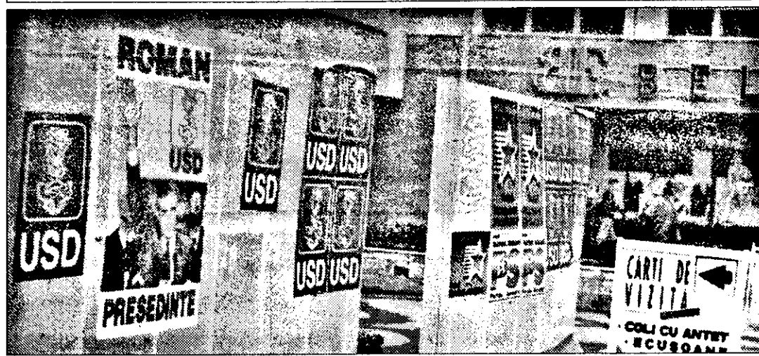
La „Ziridava”, „cărțile de vizită” ale partidelor sunt întregi.

D orind să aflăm în ce fel au înțeles partidele politice să demareze în campania electorală, am efectuat un scurt raid, urmărind panourile electorale și vitrinele magazinelor. Constatarea a fost că până acum doar partidul de guvernământ a „atacat” puternic, expunând în mai multe locuri fotografia candidatului său la prezidențiale, d-l Ion Iliescu.