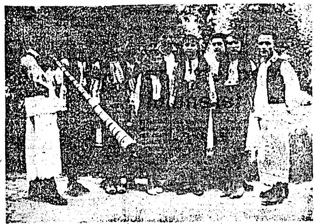
Artiști amatori din Halmăgeș.