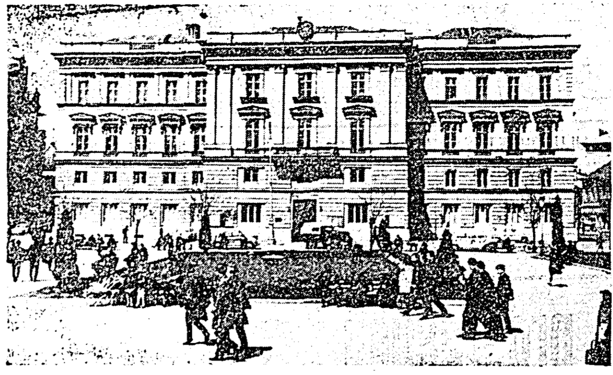
ARAD. Piața Avram Iancu în decorul însoțit al primăverii.