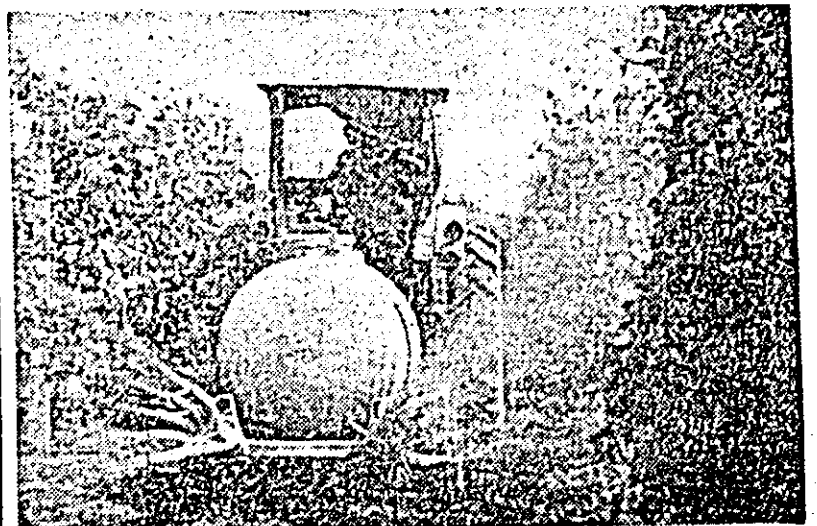
La I.A.S. Șagu, întreținerea viilor este acum una dintre cele mai importante lucrări. Astfel, stropitul se efectuează la timp și în bune condiții. Clîșeul nostru înfrățiază un aspect tocmal de la această lucrare.