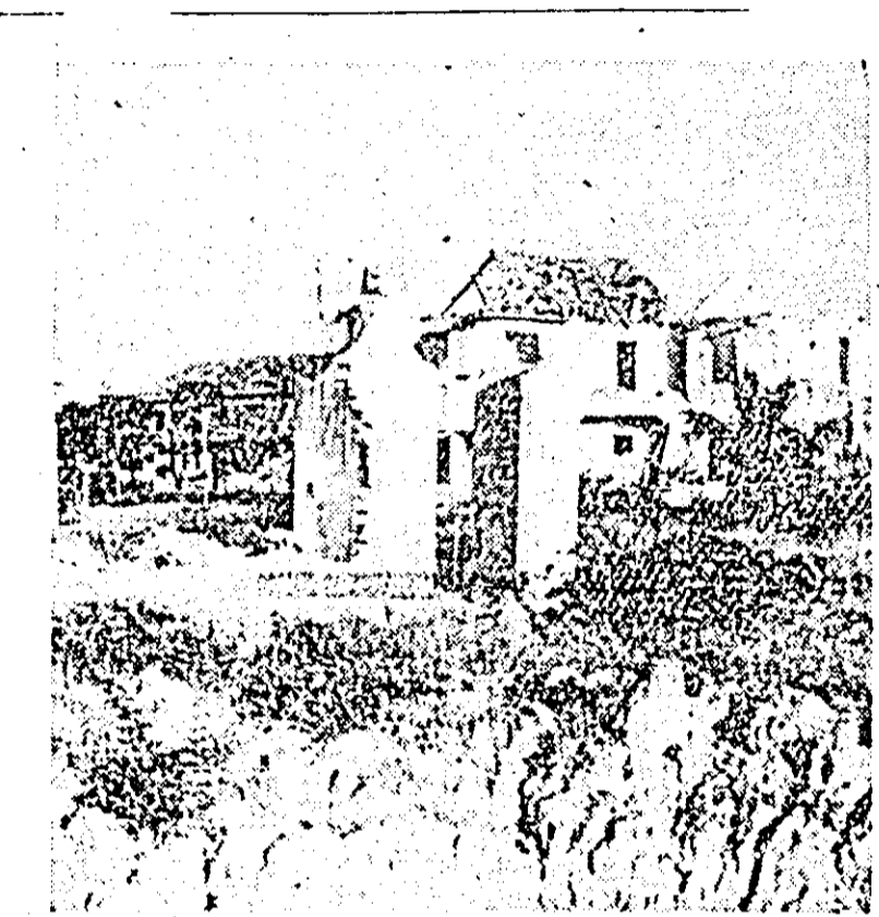
HANOI. Spital distruș în timpul unui bombardament al aviației agresorilor americani.

Sommer, a declarat că Partidul Social-Democrat „și-a hotărîrile sale în mod suveran și nu are nevoie de cenzura cancelarului Kiesinger”. Referindu-se la o afirmație a cancelarului vest-german, el a adăugat că prin declarația sa Partidul Social-Democrat nu caută să se amestece în treburile interne ale SUA, ci „pur și simplu, sprijină eforturile făcute în vederea unei reglementări pacifice a problemei Vietnamului”.