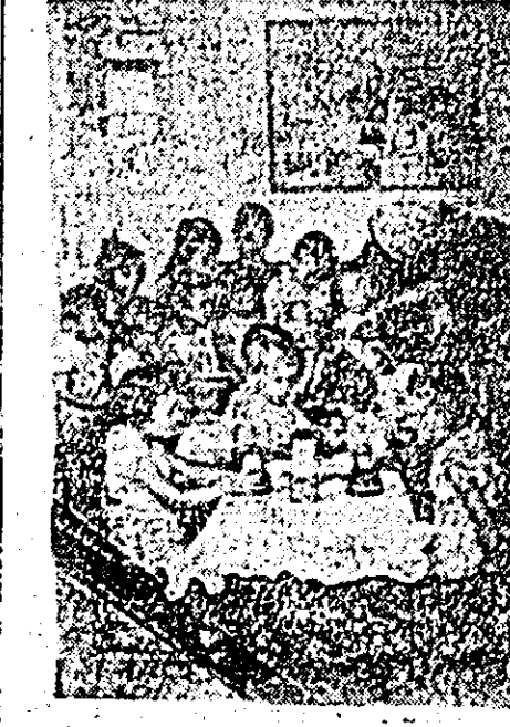
Colectiviiștii din Siria pot participa activ la muncile cîmpului; copiii lor sînd bine îngrijiți în timpul zilei la grădinița colectivă.

la una din batozele gospodăriei agricole colective. Jocurile distractive au încheiat cele câteva ore de muncă. Aproape zilnic „dizutori voluntari” din rîndul pionierilor se deplasează la arile de troler unde duc zăre, reviste și cărți. Nici adunările pionierești nu sînt neglijate. Detașamentele 6 și 7 au ținut adunări de detașament, în care au fost primii 10 din cei mai merituoși școlari în cadrul organizației de pionieri. Brigăzile de pionieri, care participă la concursul „Micul naturalist” au îngrijit lotul școlar, valorificîndu-se cantități de ceapă, fasole și roșii. Suma obținută împreună cu cel peste 1.000 de lei realizați din serbări, va fi folosită zilele acestea pentru organizarea unei excursii la Orșova. În toate acțiunile noastre am căutat să atragem și pionierii din celelalte unități cit și pe școlari. Pionierii care nu au plecat în tabere la munte sau mare sînt mulțumiți că își pot petrece timpul liber în mod plăcut și atractiv. TIBERIU URȘU, coresp.