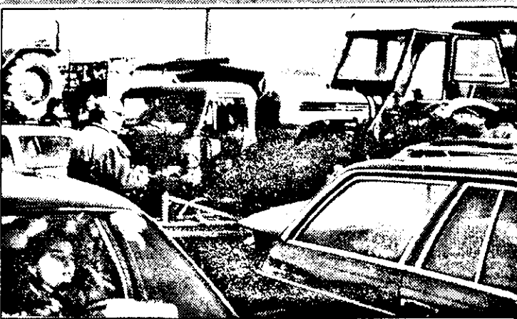
Ieri, la Piața Auto de la Hipodrom, oferta a fost deosebit de mare și diversă: de la autoturisme până la tractoare și autocamioane.

● Dacia 1300 (an de fabricație 1976) 2.000 D.M., Dacia 1300 (1978, cu îmbunătățiri) 2.500 D.M., Dacia 1310 (1983) 2.300 D.M., Dacia 1310 (1985) 2.700 D.M., Dacia 1310 (1987) 3.300 D.M., Dacia 1300 (1988) 2.900 D.M., Dacia 1310 T.X. (1983) 2.600 D.M., Dacia 1310 (1987) 3.800 D.M., Dacia 1310 TX (1989) 3.500 D.M., Dacia 1310 (1991) 3.800 D.M., Dacia 1310 (1992) 4.100 D.M., Dacia 1410 (1995) 6.100 D.M., Oltcit (1992) 2000 D.M., BMW 125 (1983) 3.100 D.M., BMW 323 (1986) 5.300 D.M., BMW T.D. (1986) 5.800 D.M., Mitsubishi Galant (1985) 4.500 D.M., Mazda 626 (1984) 3.000 D.M., Suzuki (1983) 3.000 D.M., Toyota (1994) 12.500 D.M., VW Passat (1986) 3.700 D.M., Ford Sierra (1985) 2.950 D.M., Ford Sierra (1986) 3.500 D.M., Ford Sierra