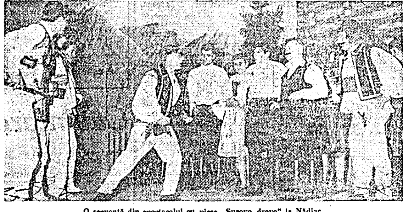
O scenă din spectacolul cu piesa „Surovo drevo” la Nădlac.

Iubitorii de teatru din comuna Nădlac au în ultimul timp prilej de plăcută distingere deosebită. De curînd pe scena cîminului cultural de aici a văzut lumina premierii comediei în trei acte în limba slovacă „Surovo drevo” (Leinul crud) de Jan Bulcovan.