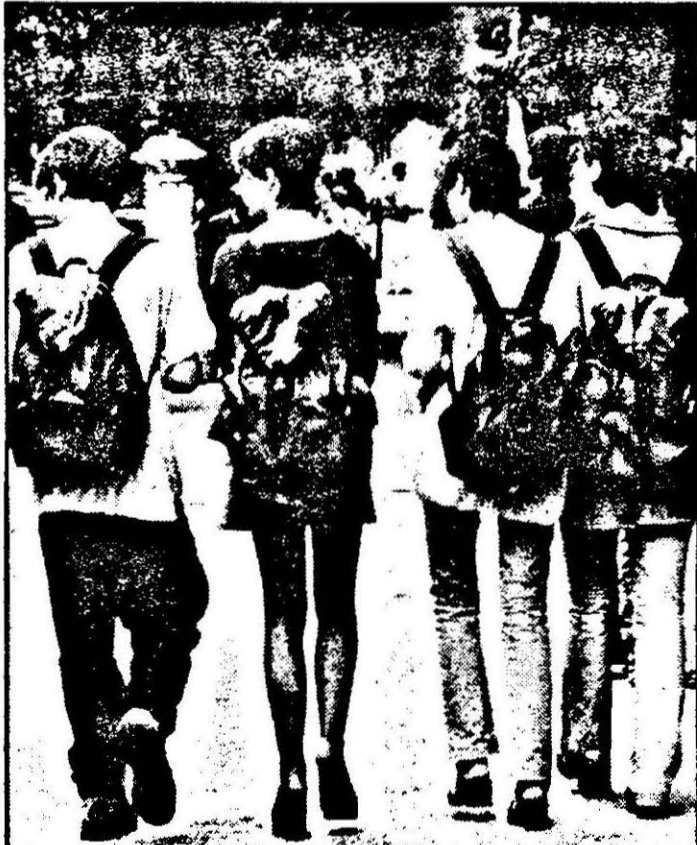
Și noi vrem în NATO

SIMION TODOCI (Continuare în pagina 4-a)