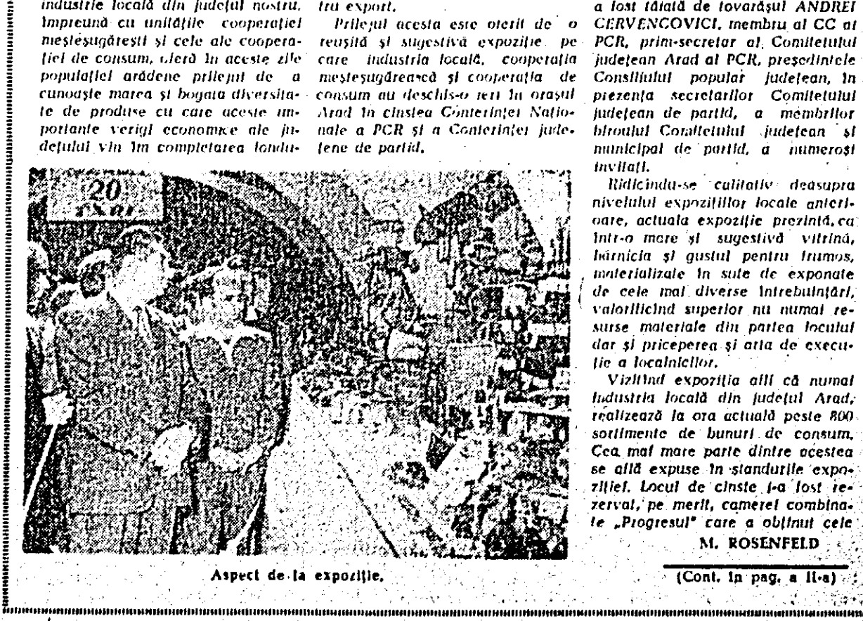
Aspect de la expoziție.