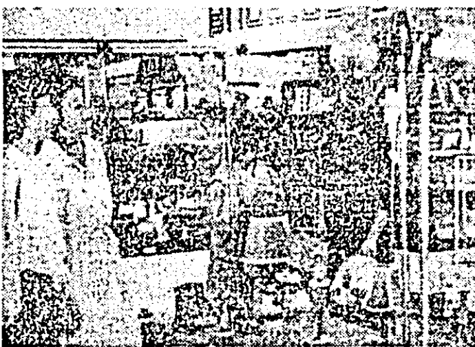
Aspect din magazinul „Electrolux” al I.C.S. mîrfuri metalo-chimice Arad.