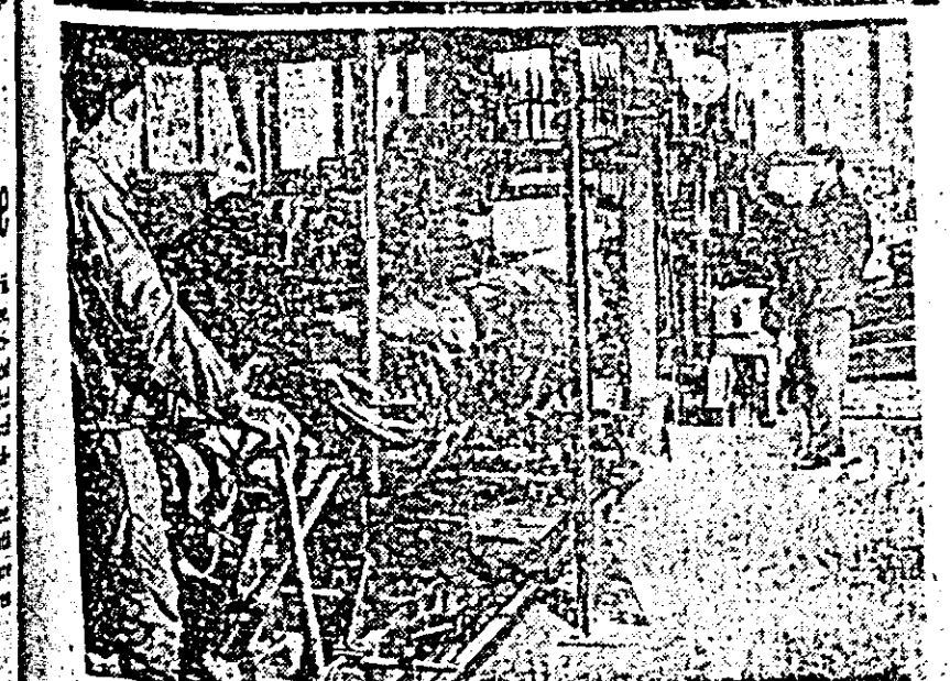
U.I.L. Arad. Sala de gatere.

COMITETULUI CENTRAL AL PARTIDULUI COMUNIST ROMÂN