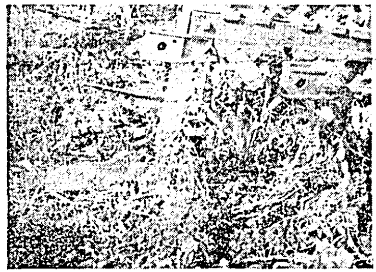
C.A.P. Simbăteni. Invațate de buruienil, plantele de porumb abia mai pot fi deosebite și solicită, la prășit, eforturi mari din partea mecanizatorilor. Și totul pentru că prașila nu a fost făcută la vreme...

Iată o situație care trebuie să dea de gîndit conducătorilor comunei Ghioroc, împunîndu-le să la măsuri ferme pentru a salva culturile de primordia îmburuienirii.