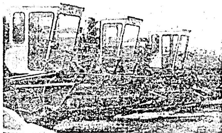
În imagine: combinele de la S.M.A. Felnac, gata de a intra în lanuri.