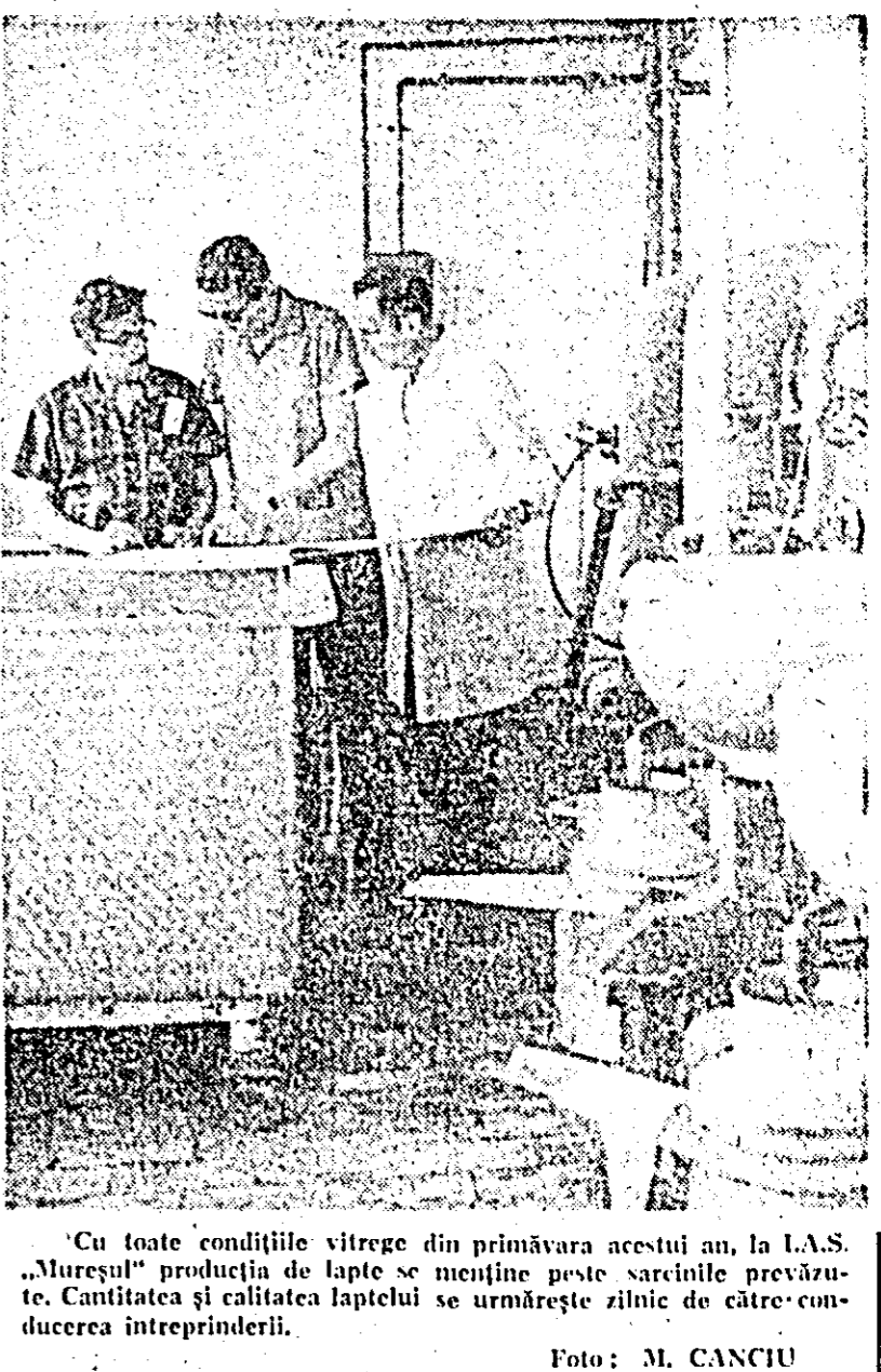
Cu toate condițiile vitrege din primăvara acestui an, la I.A.S. „Mureșul” producția de lapte se menține peste sarcinile prevăzute. Cantitatea și calitatea laptelui se urmărește zilnic de către conducerea întreprinderii.

Se renară 30 aeroterme de 100.000 calorii, 19 bancuri cu frână hidraulice cu pupitrul de comandă pentru roțar motoarelor pină la 15 CP, 227 electroincalzitoare de apă pentru grajduri, 1720 hrâniitoare pentru porci, 29 instalații pentru degresarea și spălarea pieselor și ansamblurilor din componente tractoarelor, 10 incubatoare, fiecare având capacitatea de 10.000 ouă.