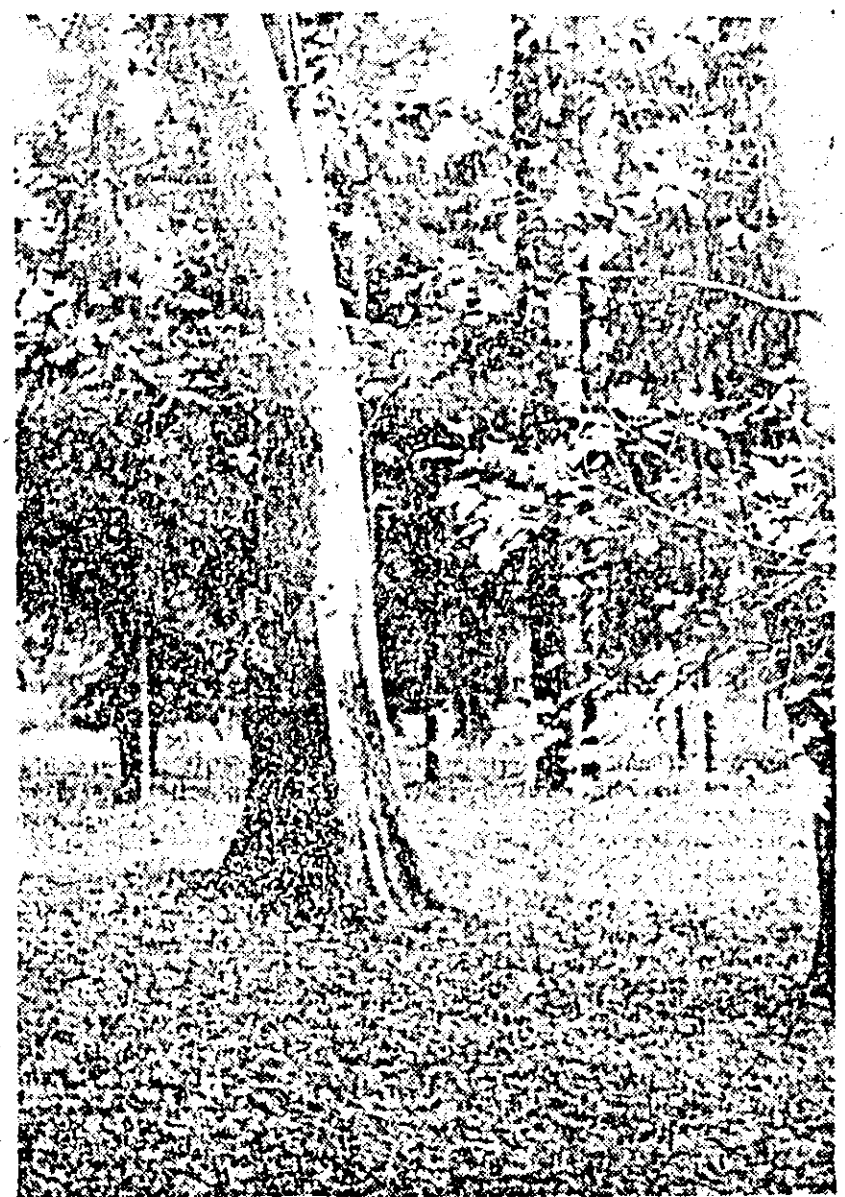
Toamnă la Săvișîn.