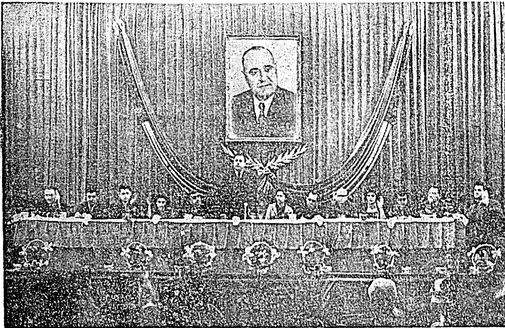
IN CLISEU: aspect din timpul lucrărilor conferinței.