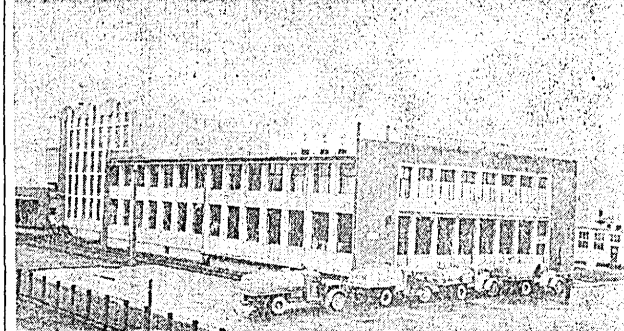
Fabrica de conserve din lapte „Rarău” din Cimpulung (Suceava) este unul din noile obiective ale industriei noastre socialiste. IN FOTO: vedere generală a fabricii.

Muncitorii stufoșii din Delta Dunării au recoltat de la începutul acestei campanii peste 70.000 tone stuf, de peste două ori mai mult decît în aceeași perioadă a anului trecut. În unitățile stufoșilor de la Rusca, Pardina, Sontea și Sullna se lucrează cu peste 160 recoltoare și tot atîtea agregate pentru transportarea stufului. Mai mult de două treimi din stuful recoltat pînă acum a fost balotat și expedit spre combinatul de celuloză de la Brăila. Acest succes se datorează începerii campaniei de recoltare cu circa două luni mai devreme, organizării a încă zece coloane mecanizate, completării, necesarului de cadre calificate și specializate pentru deservirea mijloacelor mecanice.