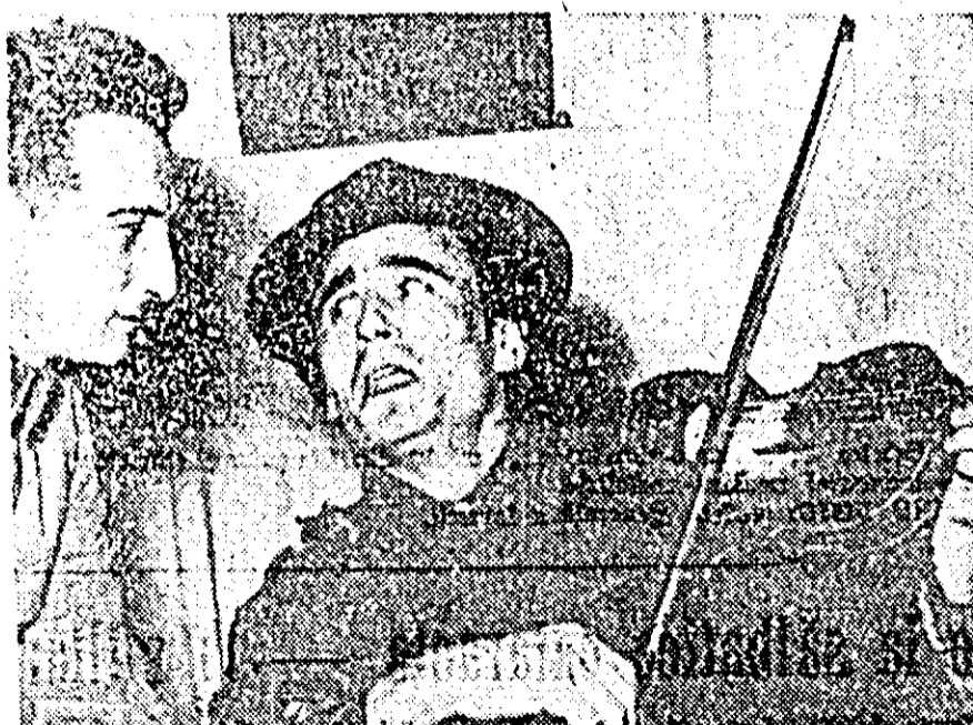
ÎN CLISEU: un aspect de la repetiția piesei "Marile fluvii își adună apele".