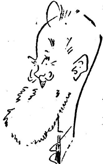
G. B. SHAW

Az új király alig volt még negyven esztendő és legényember volt. Tele volt a dicséretes szándékkal, hogy életével példát mutasson népének és így természetesen mihamar utánanézett, hogy asszonyt ültesen oldalára, még pedig lehetőleg kedves és finom asszonyt, mert a királynak igen érzékeny idegei voltak és a minisztereivel való tárgyalások bizony nem használtak valami tulajdonoson ezeknek az érzékeny idegeknek. Nos, a király már régóta ismert is egy ilyen asszonyt, akiben megvolt mindaz, amiről álmolt. Ha jól emlékszem, „Daisy Bell”-nek hívták. Amerikai asszony volt s már két házasság volt mögötte. Tökéletes párja lehetett a királynak, aki — mint mondtam — még egyszer sem nősült meg.