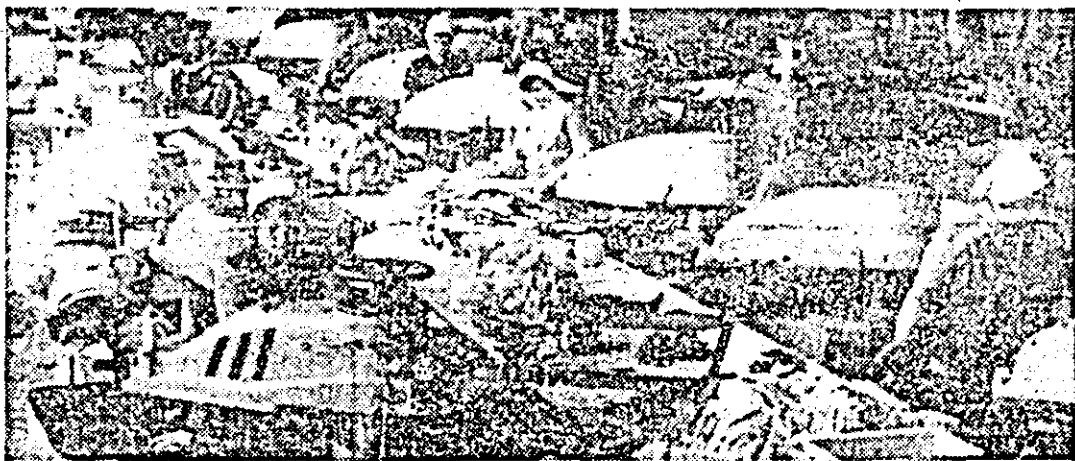
Aspect de muncă din atelierul de croit al întreprinderii „Libertatea”.