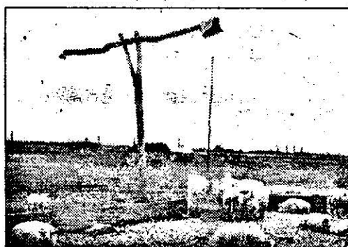
„Pe-un picior de plai / Pe-o gură de rai...”

plet către Consiliul Județean și Prefectură, prin care am cerut restituirea celor 303,5 ha de pășune. Urmează, ca în prima ședință de fond funciar să se discute dosarul nostru. Noi suntem optimiști și sperăm că pășunea,