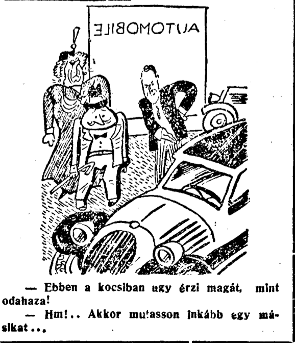
— Ebben a kocsiában úgy érzi magát, mint odahaza! — Hum!.. Akkor mu'asson inkább egy másikat...

KÉSZEKGEL BEMUTATJUK A MOST ÉRKEZETT ŐSZI UJDONSÁGOKAT. Consum-Inlesniarea tag.