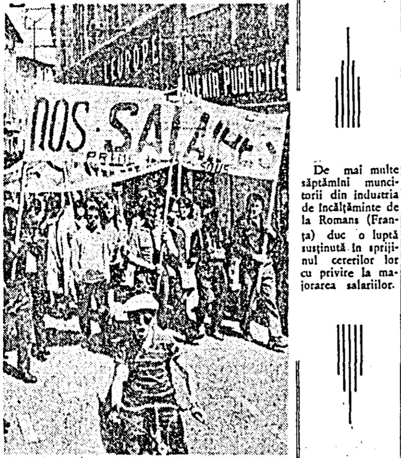
De mai multe săptămîni muncitorii din industria de încălzimente de la Roma (Franța) duc o luptă susținută în sprijinul cererilor lor cu privire la majorarea salariilor.