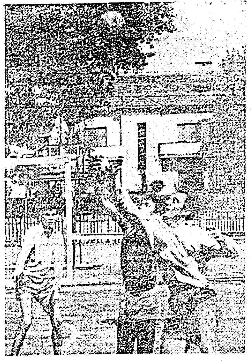
IN CLIȘEU: un aspect de la turneul de calificare la handbal în 7.