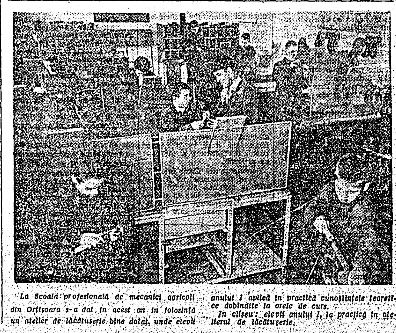
La Școala profesională de mecanică agricolă din Orăștea s-a dat în acest an în folosință un atelier de lăcătușerie bine dotat, unde elevii anului I aplică în practică cunoștințele teoretice dobîndite la orele de curs.

Dacă condițiile exterioare și de mediu au o importanță deosebită, nu mai puțin sînt de luat în considerare factorii care tin de însăși rezistența generală a organismului copilului. Destur care nu toți copiii se bucură de același grad de rezistență, diferența în această direcție fiind dată de ansamblul modificărilor produse în procesul de creștere și dezvoltare a lor.