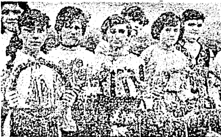
„Sinzienele” — o amplă serbare cîmpenească la poalele dealului Andreeasca (Birrava) ce valorifică creația populară tradițională și contemporană.