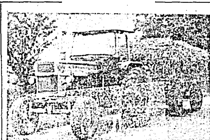
Doi tractoare aparținînd secției de mecanizare Vinga conduse de tractoristii Valeriu Cucuț și Petru Nagy transportă mazăre verde de la fermele I.P.I.F. „Relaxarea”. Așa cum se vede și din fotografie unul din tractoare avea o singură remorcă în loc de două și aceasta încărcată sub capacitate (circa 1,5 tone). În plus, remorcile sînt lipsite total de sistemele de semnalizare periclitînd siguranța circulației pe drumurile publice. Ce părere are șeful secției de mecanizare Ioan Letanov? M. CANCIU