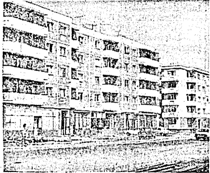
In construcție noi blocuri de locuințe în zona gării Aradului Nou.