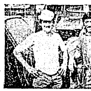
Directorul S.M.A. Vința și șeful fermei 4 al C.A.P.-ului localitate constată și dintr-o altă în urma combinelor ră-n mulți știuleți.

— Unul e în rodaj, ne spune șeful secției, iar unul nou, de circa 45 de zile, nu funcționează. Din această cauză așteptăm specialiștii de la U.T. Brașov să vină să vadă despre ce-i vorba.