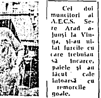
Cel doi muncitori al A.E.C.S. Sere Arad au ajuns la Vința, și-au luat furcile cu care trebuiau să încarce, palele și au lăcut cale întoarsă cu remorcile goale.