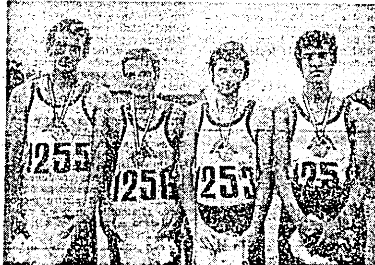
Componenții echipei de ștafetă a liceului „Ioan Slavici” din Arad.