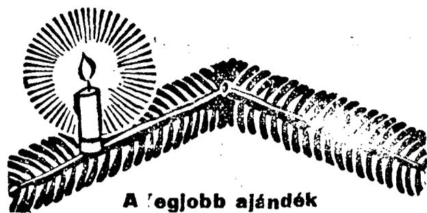
A legjobb ajándék