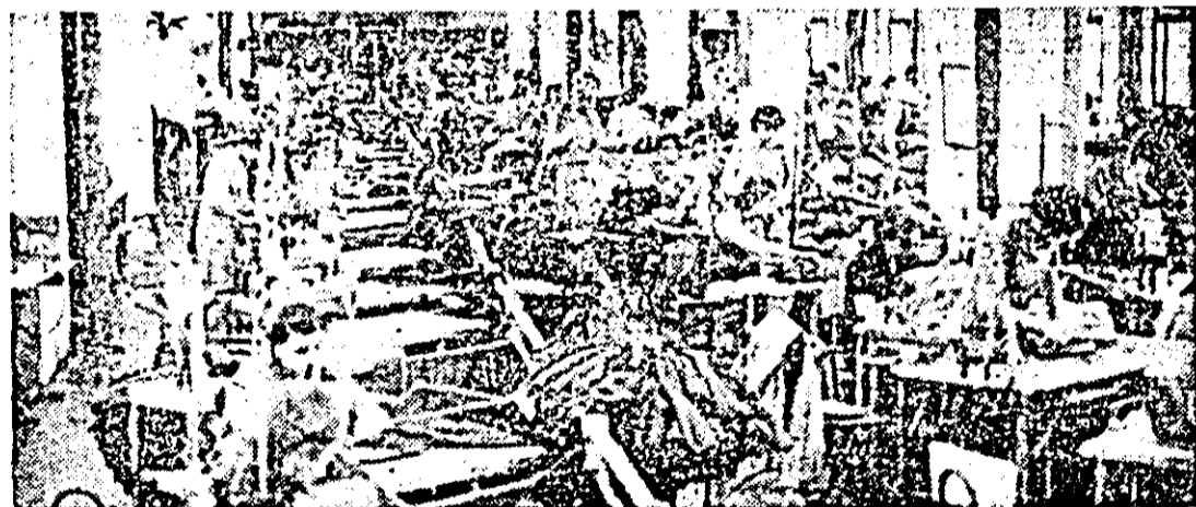
Întreprinderea de confecții: secvență de muncă din atelierul de confecții I.