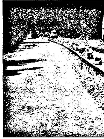
Carosabilul va fi lărgit în medie cu 1-2 metri, lățimea finală urmând să ajungă la 9 metri.