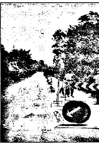
Lucrările se execută fără întreruperea circulației, alternativ pe câte un sens de circulație.

Pe teritoriul județului Arad va fi reabilitat și modernizat D.N. 7 pe tronsonul Nădlac-Zam, lucrările demarând în acest an. Tronsonul respectiv are o lungime de 150 km