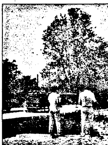
La intrarea pe teritoriul județului Arad dinspre Hunedoara, au început lucrările de reabilitare a Drumului Național 7, pe tronsonul Zam-Nădlac.

de siguranță. Investiția presupune și efectuarea reparațiilor capitale la podurile existente pe traseu, iar la Păuliș se va executa un pasaj superior peste calea ferată, eliminându-se astfel staționările autovehiculelor la barieră. Odată cu executarea reparațiilor capitale la poduri, acestea se vor consolida iar partea carosabilă aferentă lor va fi lărgită la 7,80 m. Pe perioada acestor lucrări circulația se va desfășura pe scurte variante ocolitoare fiind utilizate poduri provizorii, iar la cele la care nu se va executa lărgirea părții carosabile,