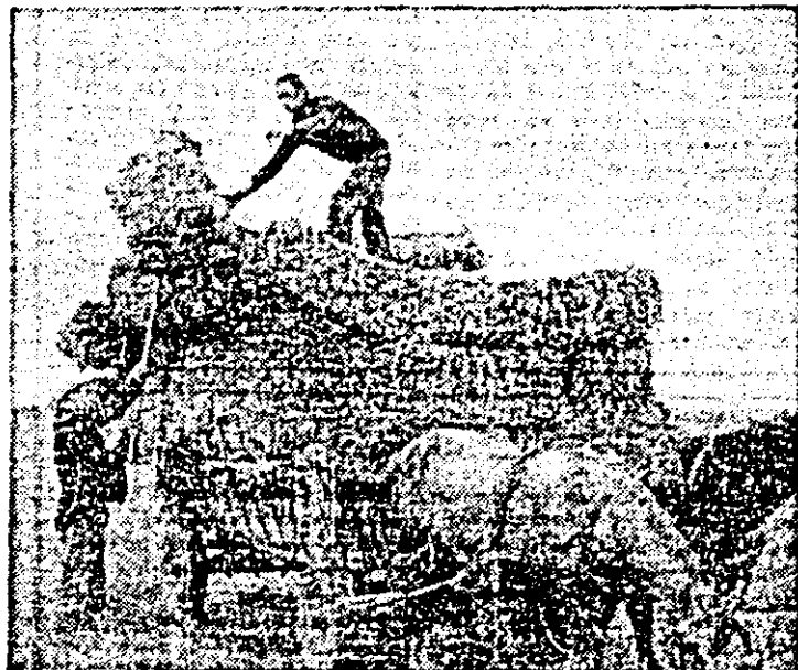
La urgențarea eliberatului terenului și transportul palete-lor, la C.A.P. Felnac sînt utilizate cu mult succes atelajele hipo.

Telefoanele primite sîmbătă seara la redacție ne-au adus vesti îmbucurătoare, informându-ne despre încheierea recoltării grâului în numeroase alte unități agricole cooperatiste și de stat.