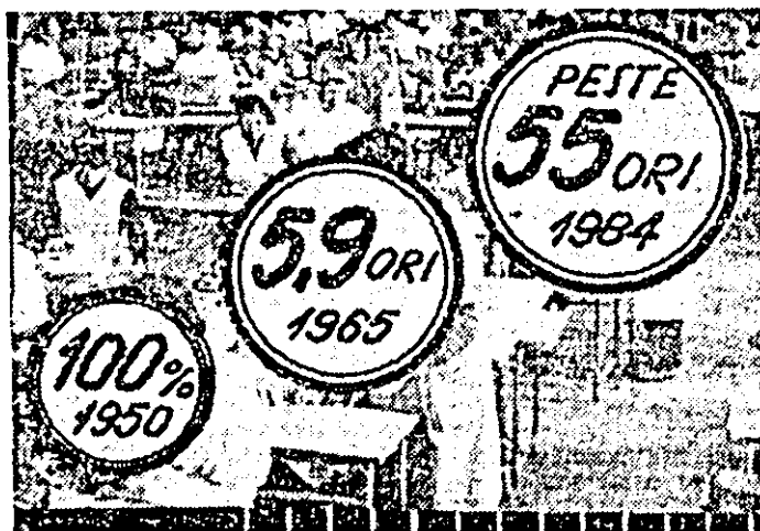
Dinamica producției marfă industrială a întreprinderii „Libertatea”.

Întocmiți monografia tine însă să releve un aspect esențial.