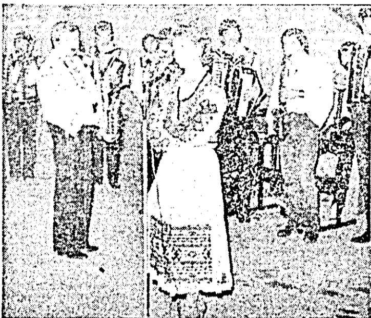
Pe scena Festivalului Național „Cîntarea României” — orchestra de muzică populară a Casei de cultură a municipiului.