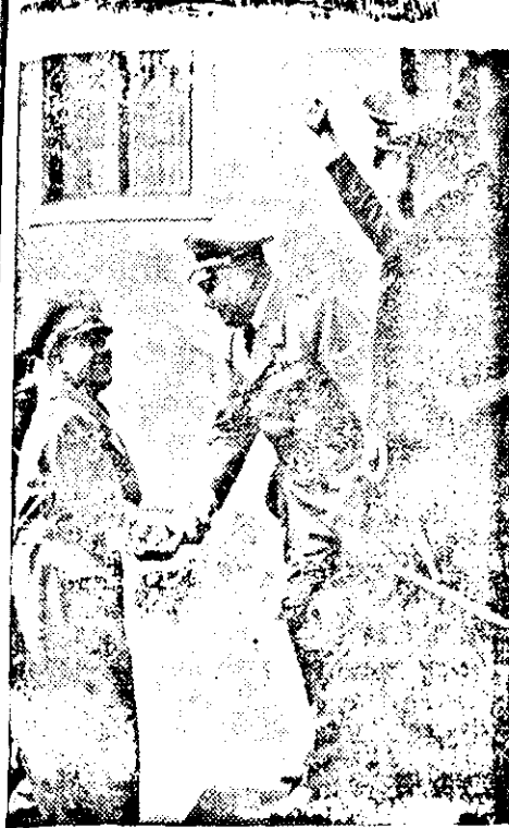
Graf Ciano in Berlin