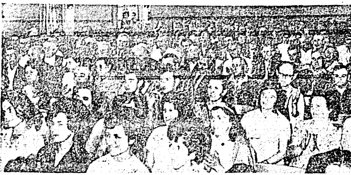
Aspect din sala căminului cultural de la Siria, unde recent a luat ființă prima Asociație culturală din județul Arad.