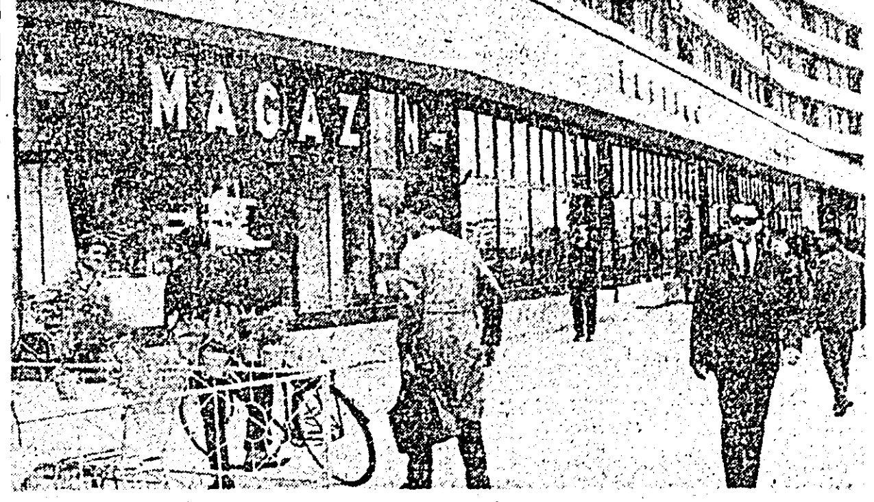
Piața Gării. O nouă zonă modernă a municipiului.