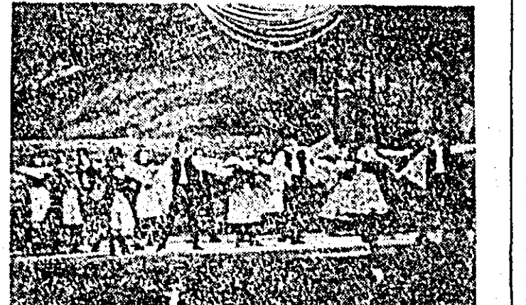
În clișeu o scenă din baletul „Năframa”, prezentat de colectivul Teatrului de operă și balet din Cluj, pe scena Teatrului de vară din orașul nostru.

capitul povestirilor. Pe unii valurile vieții l-au alungat spre alte meleaguri, pe alții anii l-au mutat la cîmîtir. Puștani au crescut și dragostea a început să le pună inimile la încercare. Viața își urmează cursul ei firesc. Figura cîntită, prietenească și dirză a lui Maciste e pomînită adesea cu drag, ea simbolizează pentru locuitorii viei del Corno lupta neobosită pentru o viață liberă, luminoasă și fericită. Cronica unor bieți îndrăgostiți este o carte închinată oamenilor săraci și cîntiți, care adesea se ceartă și se birfesc, dar care în momentele grele se ajută și se susțin unul pe altul. De asemenea, este o carte închinată tineretului, dragostei și zbuciumului lui. Pratolini scoate la iveală caracterul criminal și antiuman al fascismului și al metodelor lui de respingere folosite împotriva elementelor înalțate ale societății. Portretul fizic și moral al comunistului Maciste, e zugrăvit cu multă căldură și dragoste. Aceeași dragoste și înțelegere o vedește scriitorul pentru toți necăjiții locatarii ai viei del Corno. Ca un adevărat italian ce este, Pratolini aduce în cartea sa multă culoare și melodie, carnavaluri și petreceri zgomotoase, certuri și scapdături, țipete de copii și soare, mult soare.