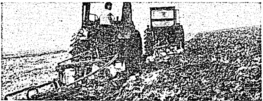
Pe ogoarele Galului, mecanizatorul brăzdează miriștea proaspătă pregătind terenul pentru noile culturi.