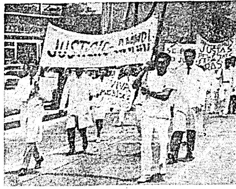
Aspect de la o recentă demonstrație a medicilor din Mexico City, aflați în grevă. Bravind ultimatum-ul guvernului de întoarcere la lucru, medicii greviștii au fost conștienți. Pe pancartele demonstrațiilor se află inscripția prin care cer „Justiție”.

ONU, care au rămas vineri seara în pozițiile ocupate de trupele constituționaliste, au fost marțorii unei noi violări a acordului de încetare a focului, cînd, din direcția pozițiilor nord-americane, au fost trase focurile de mortier asupra acestei zone. O femeie și un copil au fost uciși, iar șase persoane au fost rănite.