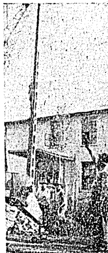
În Orășoara se modernizează linia de înaltă tensiune, lucrare executată de muncitorii Uzinei electrice Arad.

Un colectiv de oameni de știință de la Institutul de cercetări forestiere — stațiunea Brașov, în colaborare cu specialiștii Uzinei „Metrom”, au realizat un fierăstrău acțional de un motor în doi cilindri, destinat lucrărilor din exploatarea forestieră. Agregatul are o productivitate de tăiere în lemn de fag de 50 cm patrași pe secundă, ceea ce îl situează la nivelul celor mai bune produse similare din străinătate. Sub raportul puterii specifice, însă, el depășește mult agregatele asemănătoare, deși are o capacitate cilindrică cu 25 la sută mai mică.