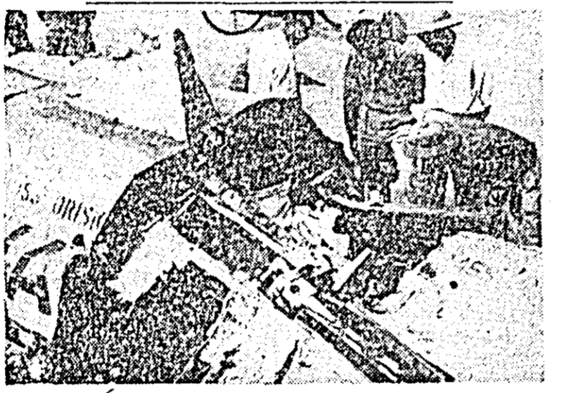
Unul dintre avioanele americane doborîte deasupra teritoriului RD Vietnam.

bine de o săptămînă patrioții desfășoară o ofensivă de mare anvergură. Corespondentul agenției France Presse relatează că luptele s-au desfășurat aproape în tot cursul zilei și că 18 soldați americani au fost uciși, iar 86 răniți.