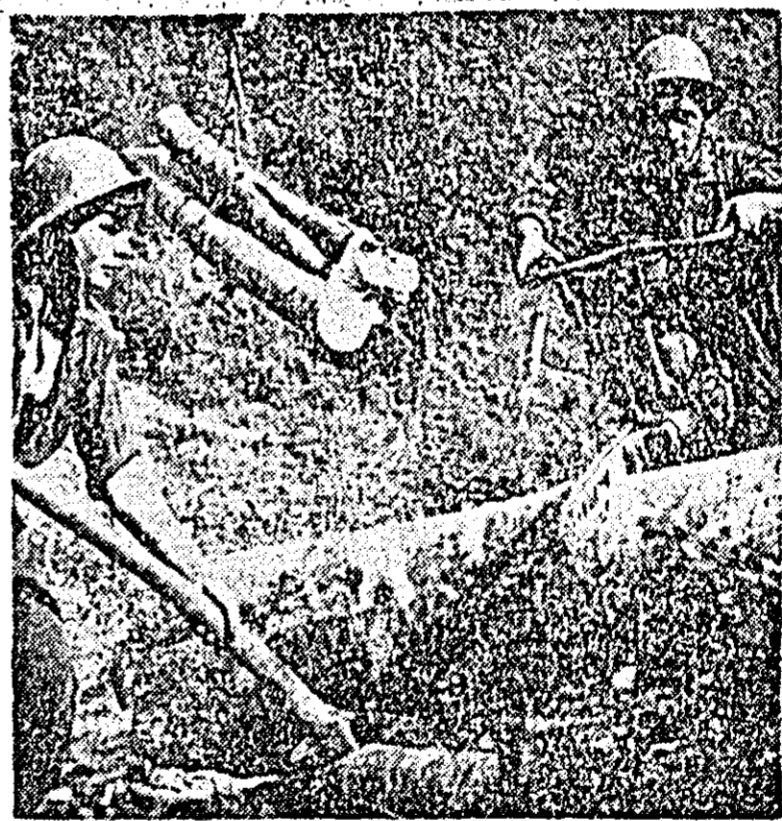
În pădurile din Valea Derzască.

nica. Cromatograful poate găsi aplicații în toate laboratoarele de chimie din instituțiile de cercetare sau întreprinderile industriale.