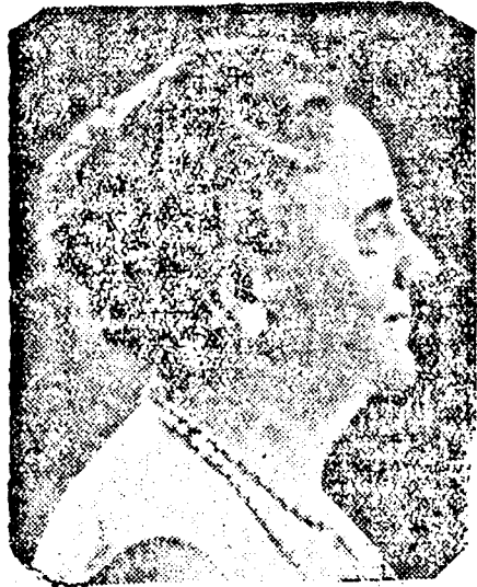
VILMA holland királynő

Proprietar: Societatea Anonimă pt. editura ziarului Aradul Közlöny, Inreg. în Reg. Publ. Periodică sub No. 10/1-1938, Trbf. Arad.