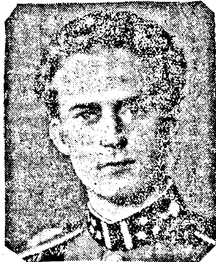
LIPÓT belga király

„Lengyelország irányában vállalt kötelezettségünket végre akarjuk és tudjuk hajtani”, — jelentette ki az angol kormányelnök