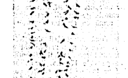
Centrul meteorologic Arad comunica: