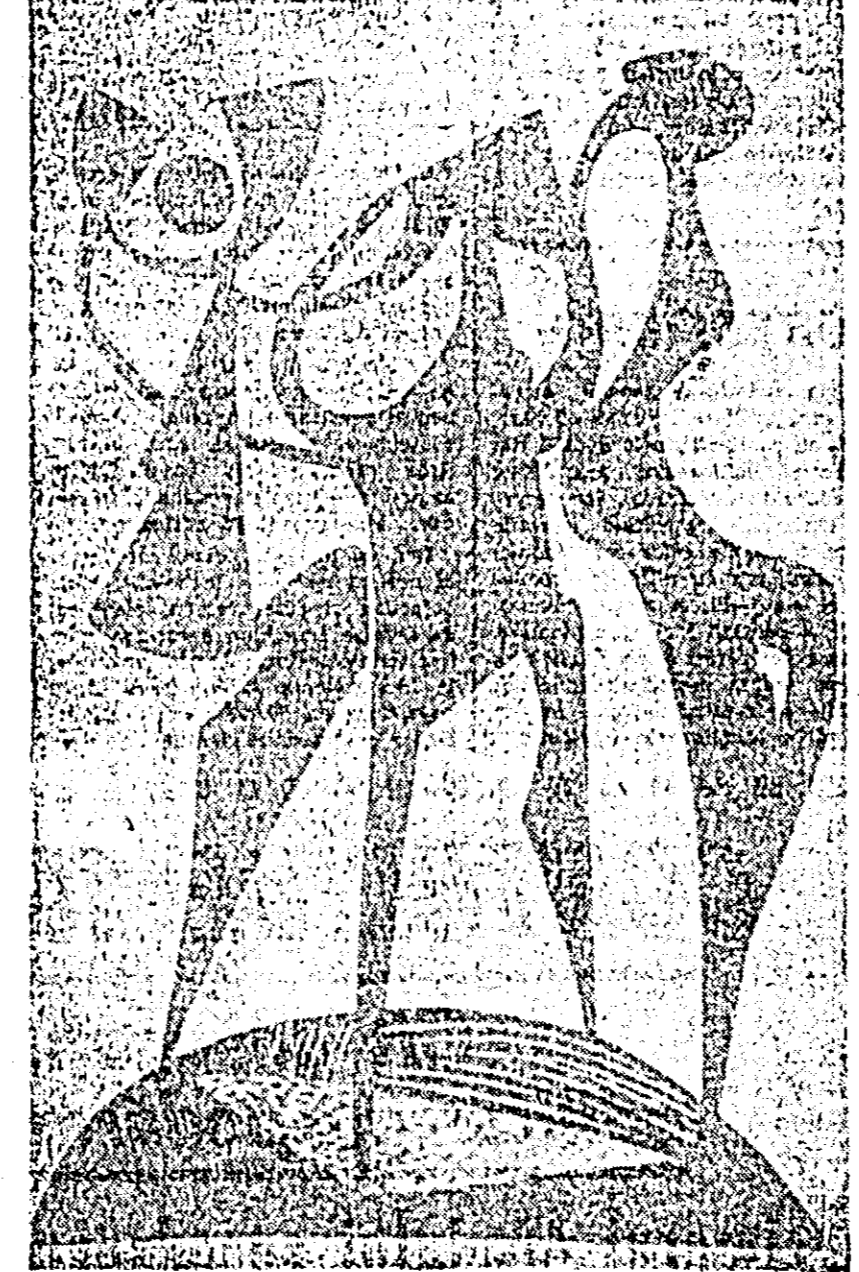
„RITM” LINOGRAVURĂ DE LIA COTT

Unul concert pentru violară a lui Cealikovski în Re major op. 35 s-a impus preluării lumii muzicale, întâi la Londra, apoi în toate centrele muzicale europene; expresivitatea de esență romantică a elementelor melodice, amplificată de-a lungul celor trei părți într-o mare varietate de învesmîntări ar-