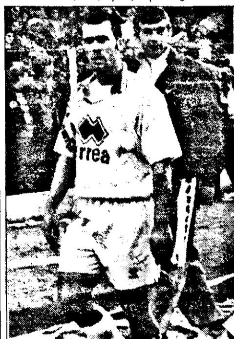
Mariș și Todea nu au putut salva UTA de la înfrângere.