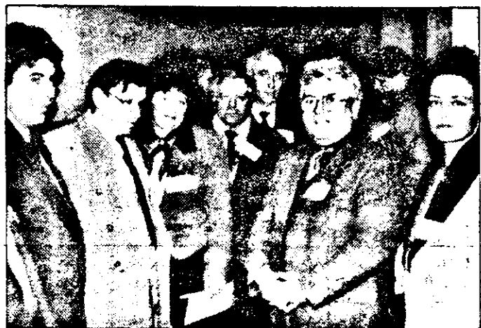
Pentru majoritatea delegațiilor la Conferința Județeană, pauza a fost un moment de relaxare. Pentru alții, care au candidat, un moment de maximă tensiune: se numără voturile!

În discursul rostit după încheierea votării, Gheorghe Funar i-a sfătuit pe membrii noii conduceri să fie foarte atenți la modul în care își vor desfășura activitatea în județ, să-și întetească eforturile, întrucât se apropie alegerile și obiectivul principal al PRM este câștigarea puterii.