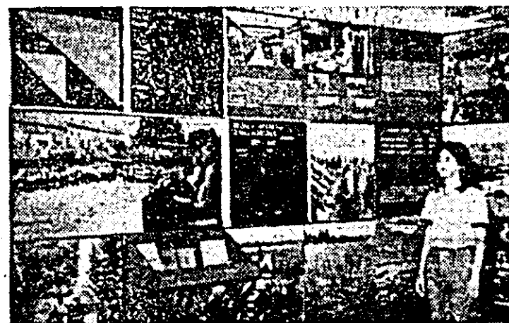
Imagini privind agricultura arădeană în anii noii revoluții agrare.

Acum, în acest iulie de aur, omul nou al meștegurilor arădene, asemenea întregului popor, omagiază cu aleasă mîndrie patriotică tot ce s-a înălțat cu biruință și lumină în anii ce s-au scurs de la Congresul al IX-lea, de cînd în fruntea partidului se află tovarășul Nicolae Ceaușescu, remarcabil patriot, proeminentă personalitate a vieții internaționale, care a făcut să se afirme plenar, împreună cu toate sectoarele vieții economico-sociale, conștiința vie, în acțiune, a devenirii noastre revoluționare.