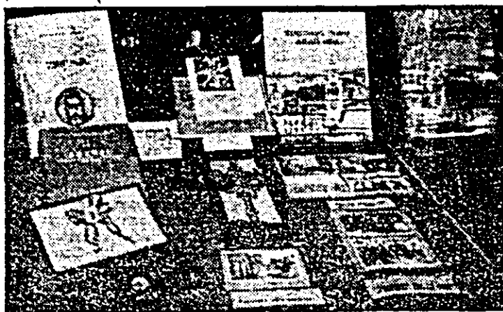
Mîrturie pentru viitor ale spiritualității arădene contemporane.