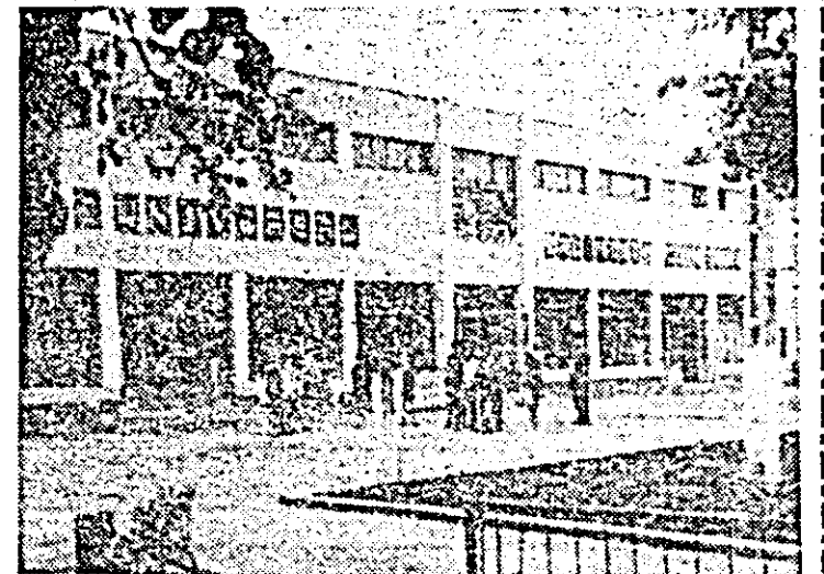
Noul complex comercial al cooperativei de consum din Seleus