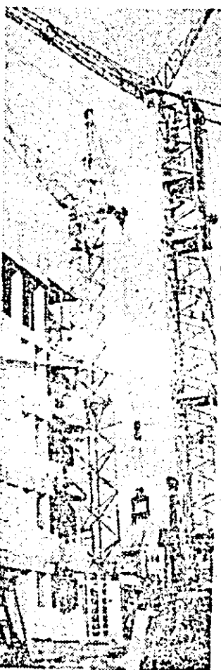
Noi construcții de locuințe în zona „Tricolor”.